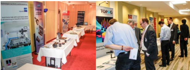
Aufnahmen früherer Table-Top-Ausstellungen

Wir freuen uns darauf, Sie im März in Nürnberg als Teilnehmer begrüßen zu dürfen.